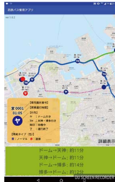
図 3 臨時バス運行管理用アプリ (Android OS 用)

1 の端末が搭載された全ての臨時バスのリアルタイムな運行状況を運行管理者が閲覧し、個々の車載端末に休憩取得や運行終了などを通知するためのアプリ（図 3）を開発しました。これにより、各車両の識別番号、車両タイプ（ノーマル／連節）、行先、位置、状態（運行中／運行終了）、累積運行時間、直近 1 便の方向別実績所要時間を俯瞰でき、とりわけ福岡都心（天神、博多）からドームへの回送状況を把握できることで、 運行管理者が後続車の間隔や車両タイプを勘案しながら、ドームから出発させるバスの行先や発車のタイミングを適切に調整 できるなどの効果が確認されました。さらに、ドームから最終便を発車させた際、全ての車載端末に運行終了の通知を同時に発信することで、 福岡都心からドームに戻る途中のバスを直ちに営業所へ帰還させ、車両の回送距離と乗務員の労務時間を削減できる可能性が明らかになりました。