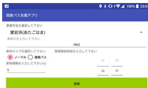
図1 車載端末用トラッキングアプリ (Android OS 用)

各臨時バス車両の運行情報をリアルタイムに送信するためのアプリ（図1）を開発しました。このアプリがインストールされたモバイル端末を全ての臨時バスに車載し、モバイルデータ通信で各車両の現在位置、運行方向、累積運行時間などのデータをサーバーに送信します。また、運行管理者からの休憩取得指示や運行終了指示を受信し、音声で乗務員に通知する機能も備えています。